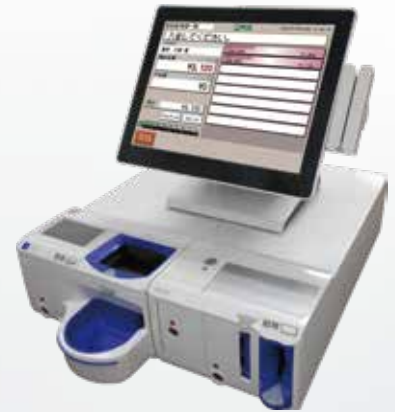
画面はハメコミ合成です

MERSYS-AR/SRの取引結果と一元管理できます。会計業務の合理化と厳正化につながります。